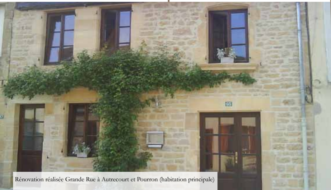
Rénovation réalisée Grande Rue à Autrecourt et Pourron (habitation principale)