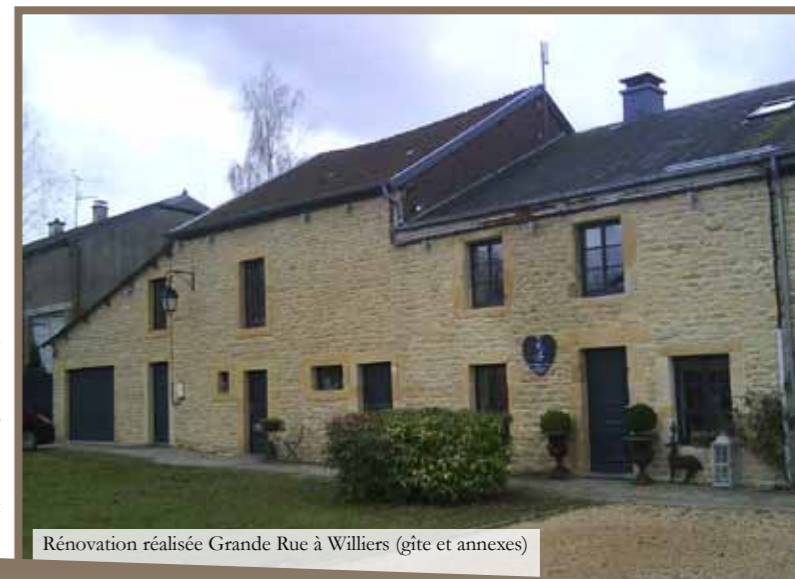
Rénovation réalisée Grande Rue à Williers (gîte et annexes)

Une dizaine de communes accordent une aide complémentaire : Beaumont en Argonne, Carignan, Douzy, Malandry, Margny, Mouzon, Osnes, Remilly-Aillicourt, Tétaigne.