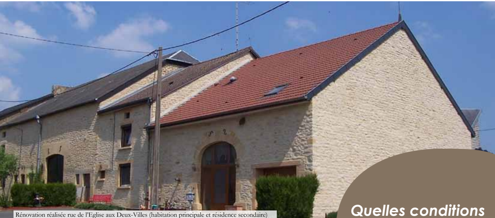
Rénovation réalisée rue de l'Eglise aux Deux-Villes (habitation principale et résidence secondaire)