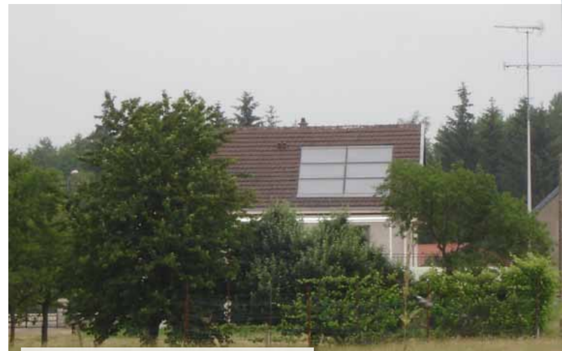
Installation de panneaux solaires réalisée rue de Malakoff à Carignan