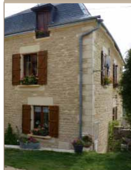
Rénovation réalisée Rue du Château à Villemontroy (habitation principale)